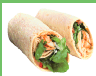
Pollo a la parrilla en tortilla de harina