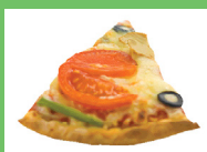
Pizza con vegetales