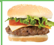
Hamburguesa con o sin queso (tamaño normal)