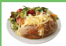
Papa asada con verduras + queso

Consiga buena comida mientras fuera de casa. Tiene una vida muy ocupada. Sea inteligente con las comidas rápidas. Busque estas opciones saludables cuando necesite una comida rápida.